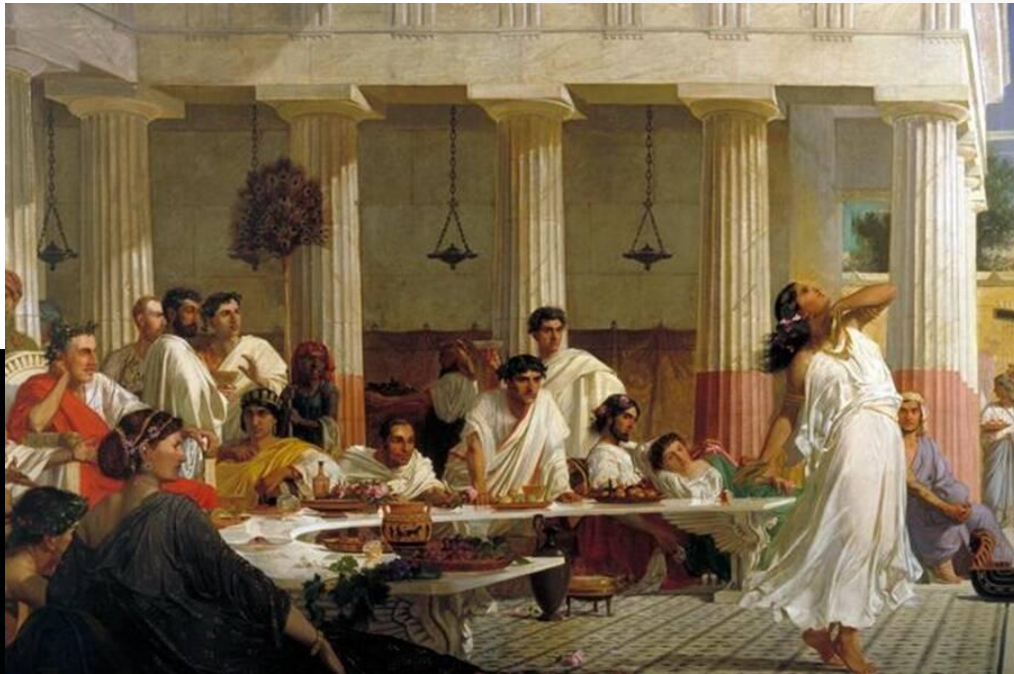
希律生日宴會上，莎樂美跳舞祝興