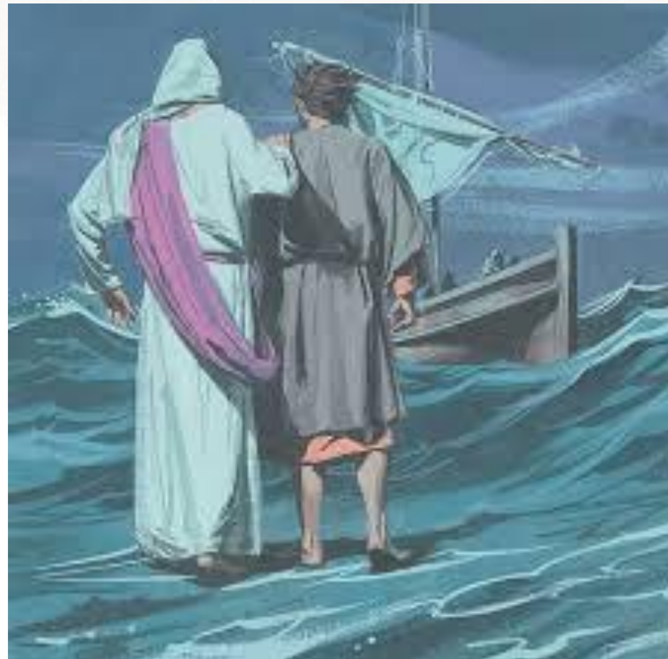
耶穌與彼得同行回到船上