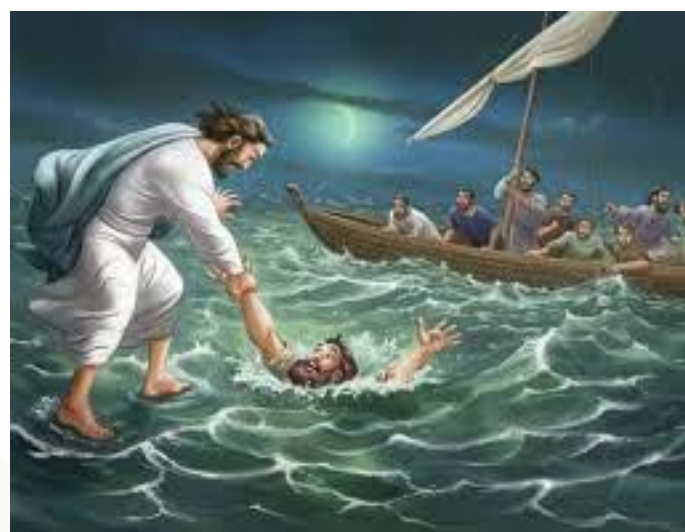
耶穌伸手拉住彼得