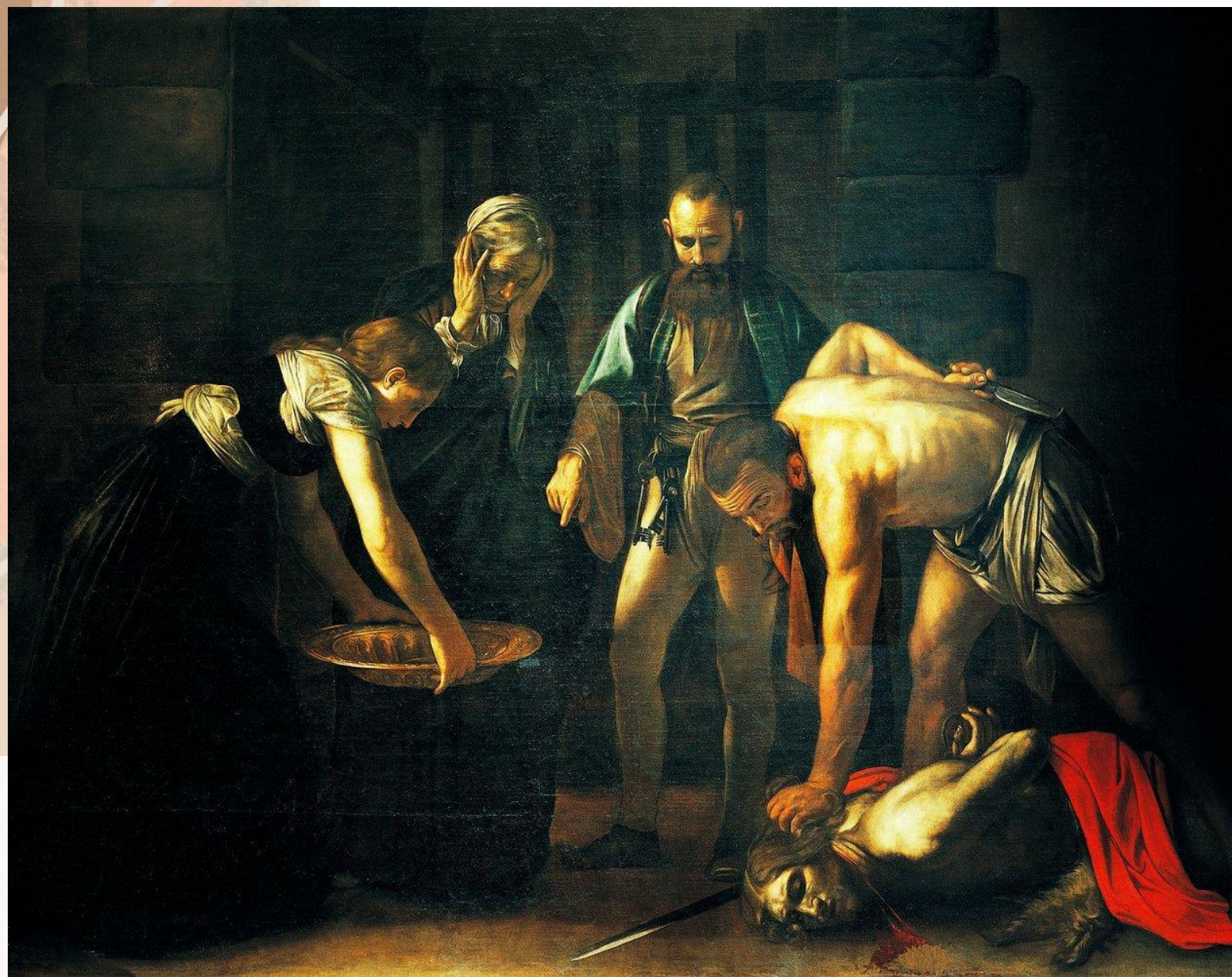
莎樂美要的賞賜，施洗約翰的人頭