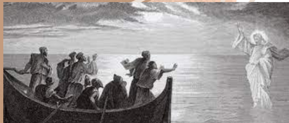
彼得也要行在水上