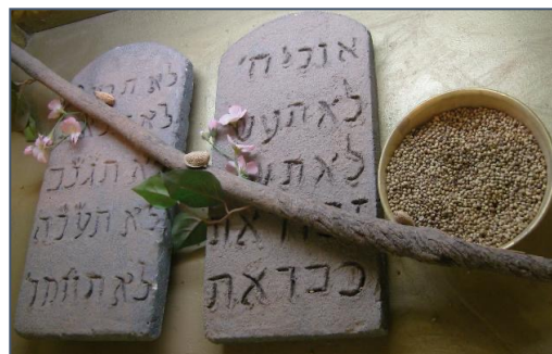
嗎哪罐 亞倫杖 兩約版