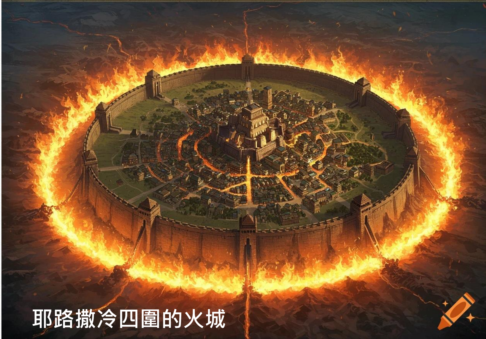
耶路撒冷四圍的火城