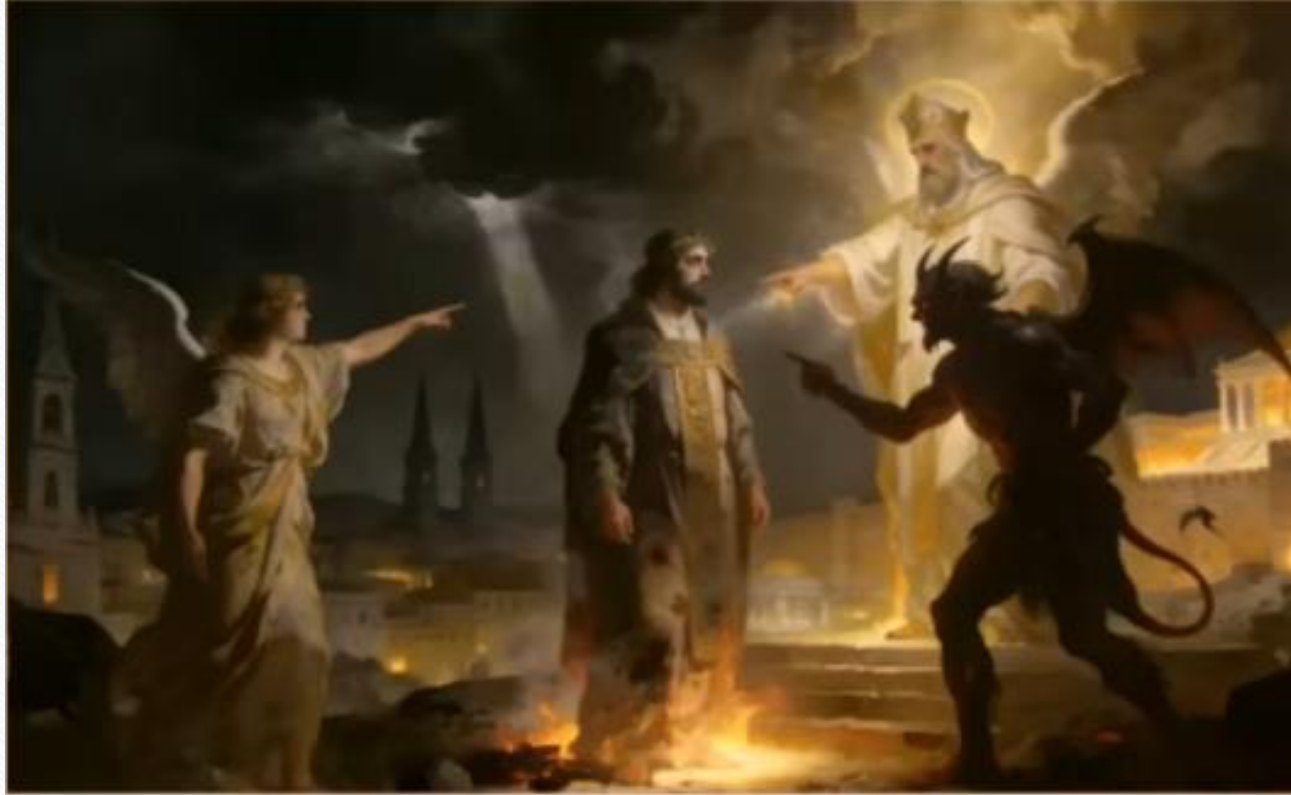
撒但控告大祭司約書亞